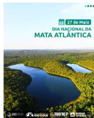
Instagram do PERD – divulgação ambiental/sensibilização calendário