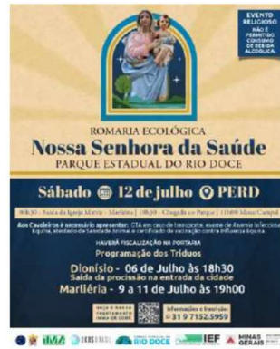
Instagram do PERD – divulgação científica/sensibilização