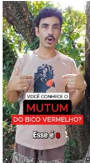
Instagram do PERD – divulgação de ações para a conservação/sensibilização