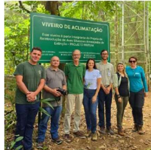
Instagram do PERD – divulgação de ações para a conservação