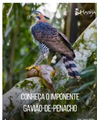
Instagram do PERD – divulgação científica/sensibilização

A seguir apresentam-se alguns exemplos das postagens, extraídas do Relatório de Resultados do 14º PA: