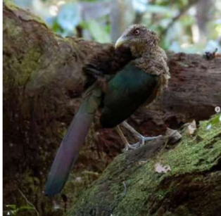
Instagram do PERD – divulgação científica/sensibilização