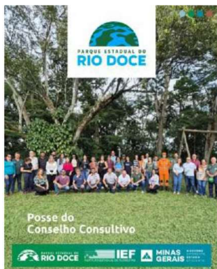
Instagram do PERD – divulgação de ações de gestão participativa