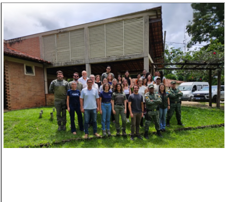
Figura 12: Registro do Workshop sobre uso da estrada do salão dourado, realizado em 11 de março de 2026. (Fonte: Instituto Ekos Brasil).

Conforme o Relatório de Resultados, o evento foi construído e conduzido integral e conjuntamente pelas equipes do Instituto Ekos Brasil e do Instituto Estadual de Florestas e teve como principais objetivos apresentar aos participantes o Diagnóstico sobre o Uso da Estrada do Salão Dourado e construir, de forma participativa, as diretrizes a serem observadas pelo IEF no futuro Plano de Uso da Estrada do Salão Dourado.