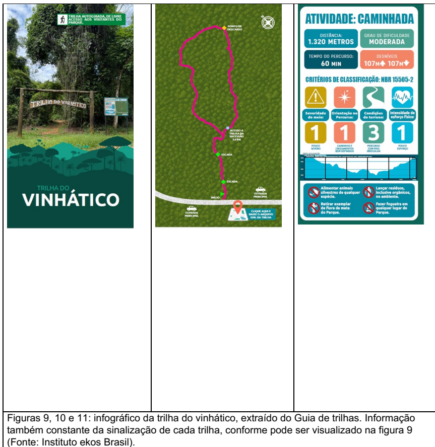
Figuras 9, 10 e 11: infográfico da trilha do vinhático, extraído do Guia de trilhas. Informação também constante da sinalização de cada trilha, conforme pode ser visualizado na figura 9.

Para além das ações de comunicação previstas no indicador, foi realizada a organização de banco de imagens, atendendo à demanda da ASCOM do IEF, com sistematização e seleção de imagens do acervo institucional para apoio às ações de comunicação do Estado.