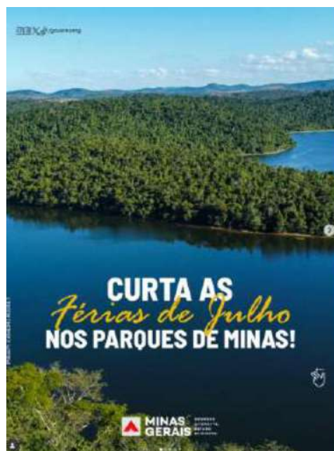
Instagram do PERD – divulgação – Férias de julho