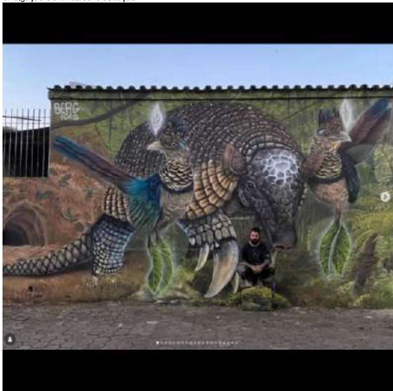
Instagram do PERD – divulgação de ações de arte e apoio à conservação