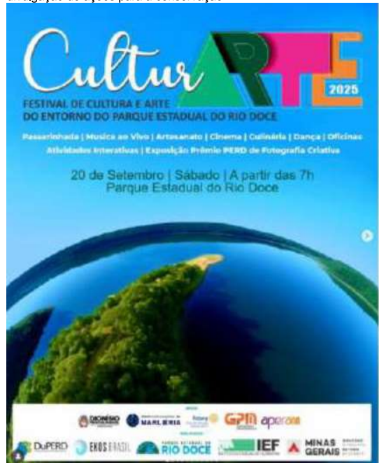
Instagram do PERD – divulgação de prêmio visando envolvimento da comunidade.