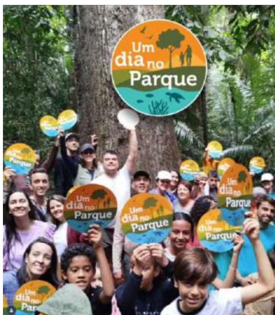
Instagram do PERD – Um dia no parque/sensibilização

A seguir apresentam-se alguns exemplos das postagens, extraídas do Relatório de resultados do 15º PA: