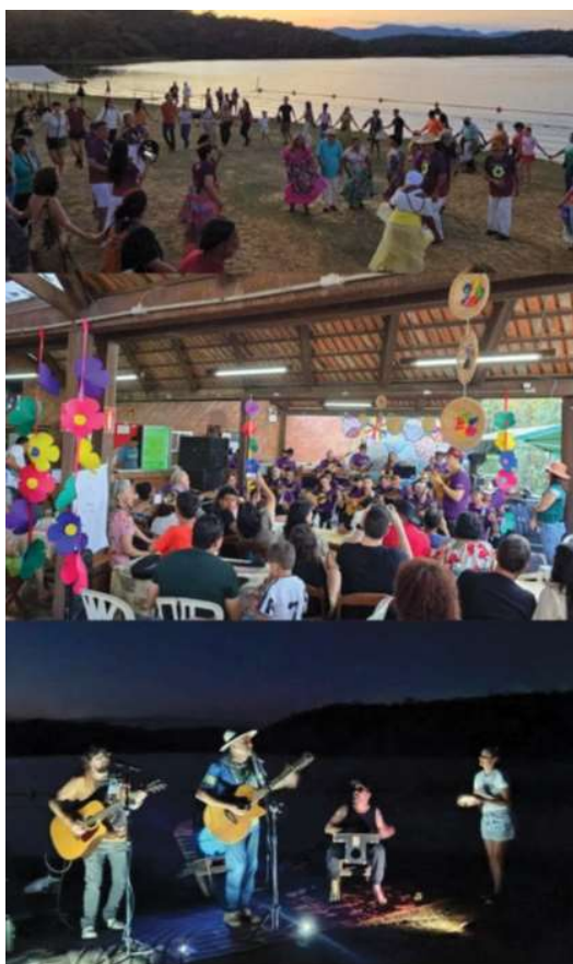
Figura 13 e 14: Trechos do Boletim Informativo do PERD (fonte: Instituto Ekos Brasil)

Assim, ao final do trimestre foram contabilizadas 93 ações de visibilidade, sendo: 90 postagens; um boletim informativo; e dois releases.