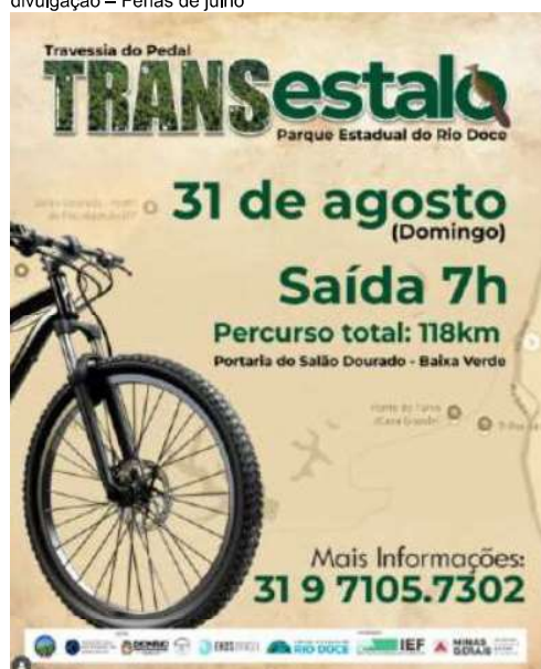
Instagram do PERD – divulgação eventos do PERD