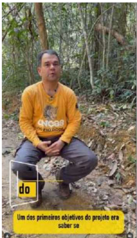
Instagram do PERD – divulgação de ações para a conservação/sensibilização – projeto Pró-carnívoros