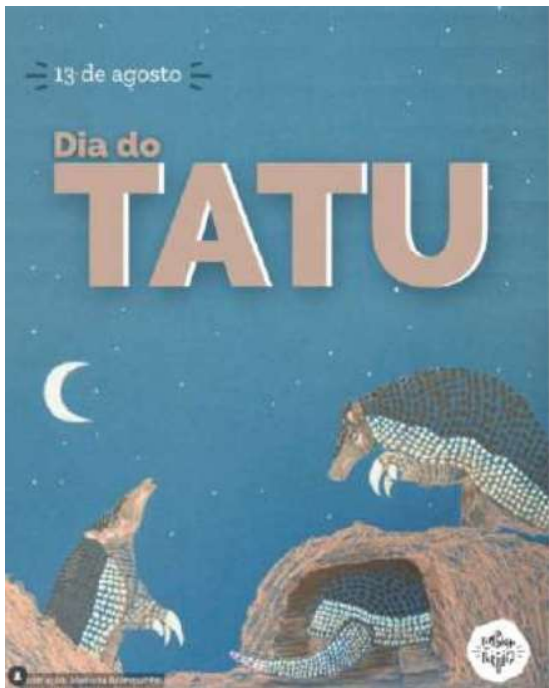
Instagram do PERD – divulgação científica/sensibilização