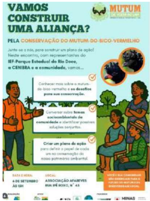
Instagram do PERD – divulgação de ações para a conservação