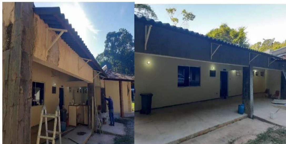
Figura 2: Sala de reunião florestal reparos nos rebocos estourados e finalização com três demãos de tinta.

A seguir apresentam-se algumas imagens extraídas deste relatório: