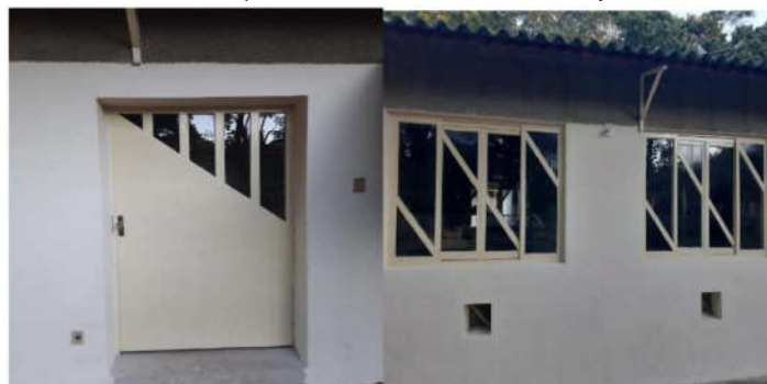
Figura 3: Viveiro sala de beneficiamento de sementes - Finalizados reparos em todo revestimento das paredes com argamassa AC2 e pinturas com três demãos de tinta em paredes, janelas e portas nas áreas internas e externas.