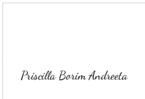
Assinatura de Priscilla Borim Andreetta

Pontos de autenticação: Assinatura na tela Código enviado por e-mail IP: 186.220.37.231 / Geolocalização: -23.545689, -46.540556 Dispositivo: Mozilla/5.0 (Windows NT 10.0; Win64; x64) AppleWebKit/537.36 (KHTML, like Gecko) Chrome/119.0.0.0 Safari/537.36 Edg/119.0.0.0 Data e hora: Dezembro 07, 2023, 13:39:07 E-mail: priscilla.borim@ekosbrasil.org (autenticado com código único enviado exclusivamente a este e-mail) Telefone: + 5511966191012 ZapSign Token: cf559dca-****-****-****-5ea0580a7d73