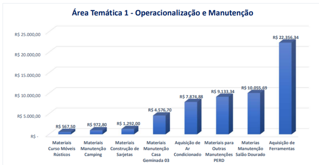
Figura 1. Aquisições do 4º Período Avaliatório. Área Temática 1 – Operacionalização e Manutenção.

No 4º Período Avaliatório foram viabilizadas diversas aquisições, conforme demanda e entendimento comum do Instituto Estadual de Florestas e Instituto Ekos Brasil. A Figura 1 apresenta as aquisições concluídas no 4º trimestre para a Área Temática 1 (AT1 - Operacionalização e Manutenção) e a Figura 2 apresenta as aquisições realizadas para a Área Temática 5 (AT5 - Fortalecimento da Pesquisa).